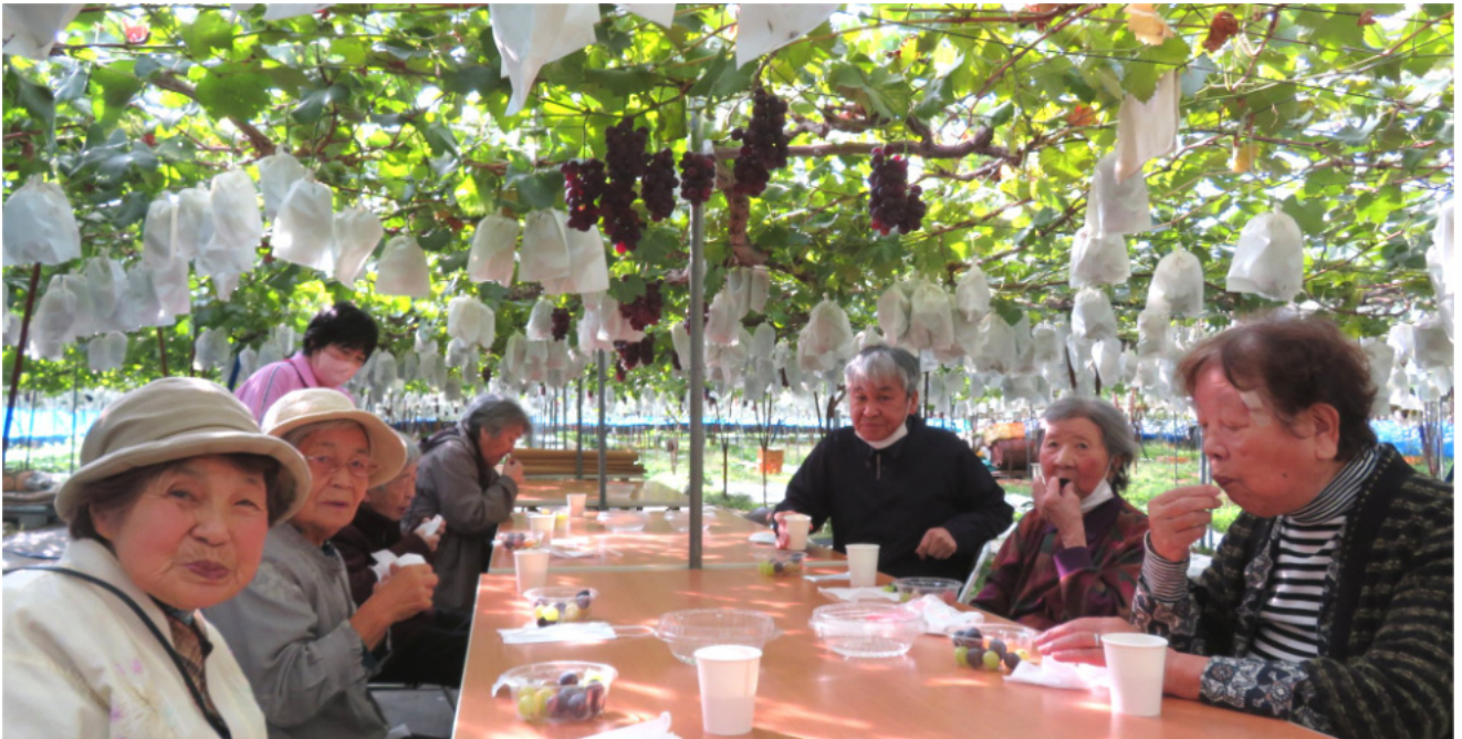
ききょうデイサービスセンターぶどう狩り