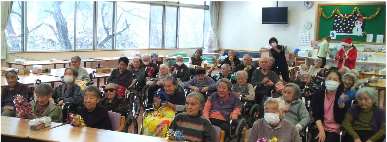
「クリスマス会」・・・職員の催し物を楽しんで見えています