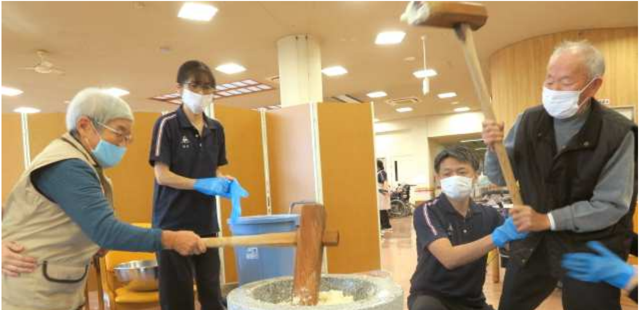
「ききょうデイサービスセンター餅つき」