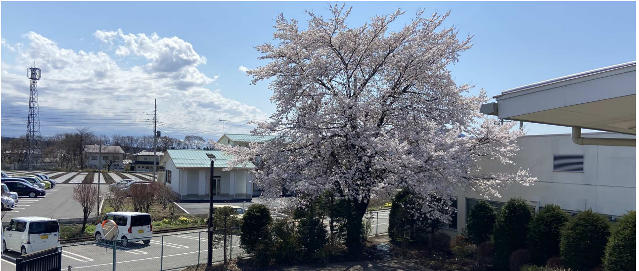
「ききょうの里の敷地に咲く桜」