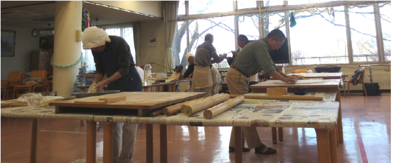
「岳遊」の皆様による蕎麦打ち