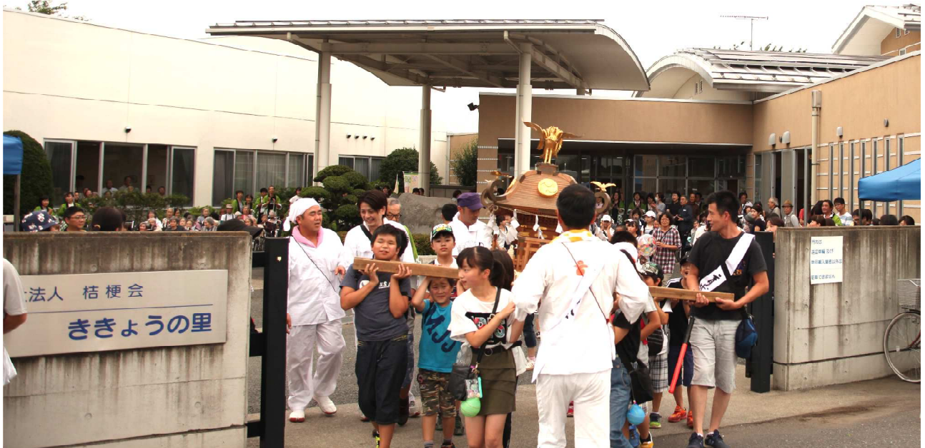
ききょうの里夏祭り