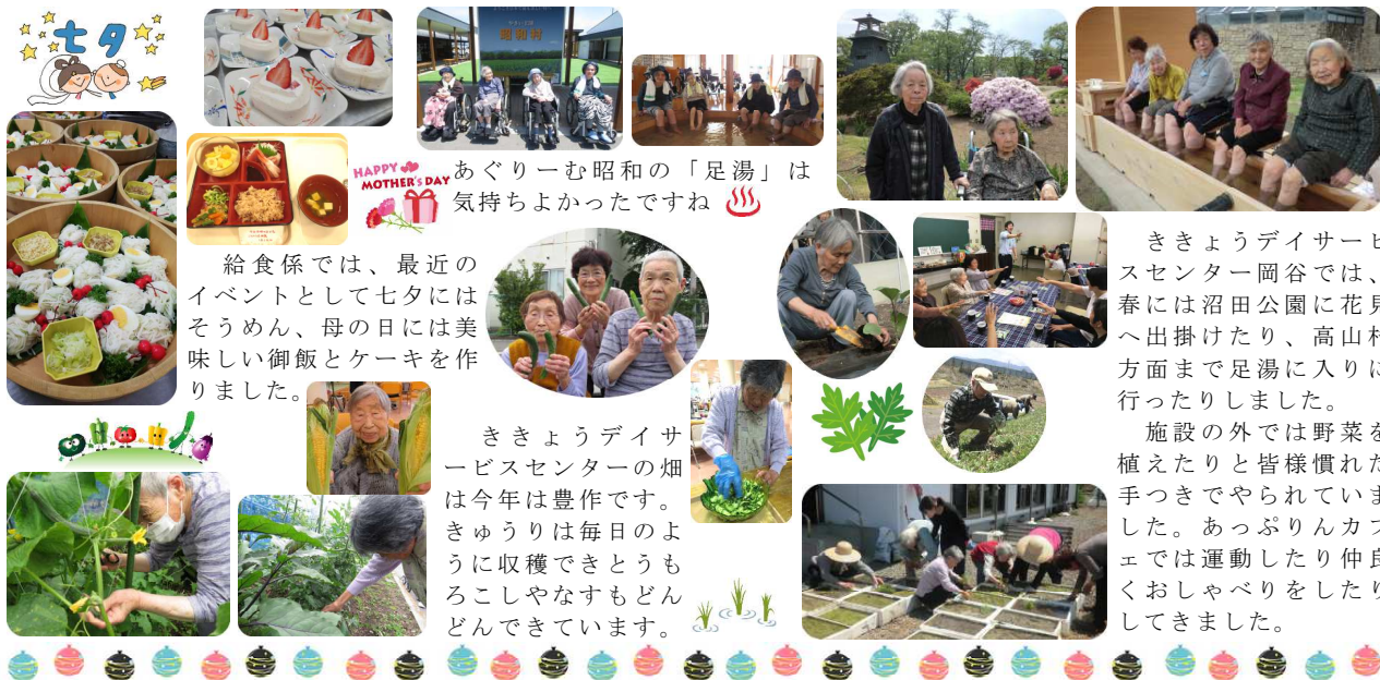
HAPPY MOTHER'S DAY あぐりーむ昭和の「足湯」は気持ちよかったですね

給食係では、最近のイベントとしてセブタにはそうめん、母の日には美味しい御飯とケーキを作りました。