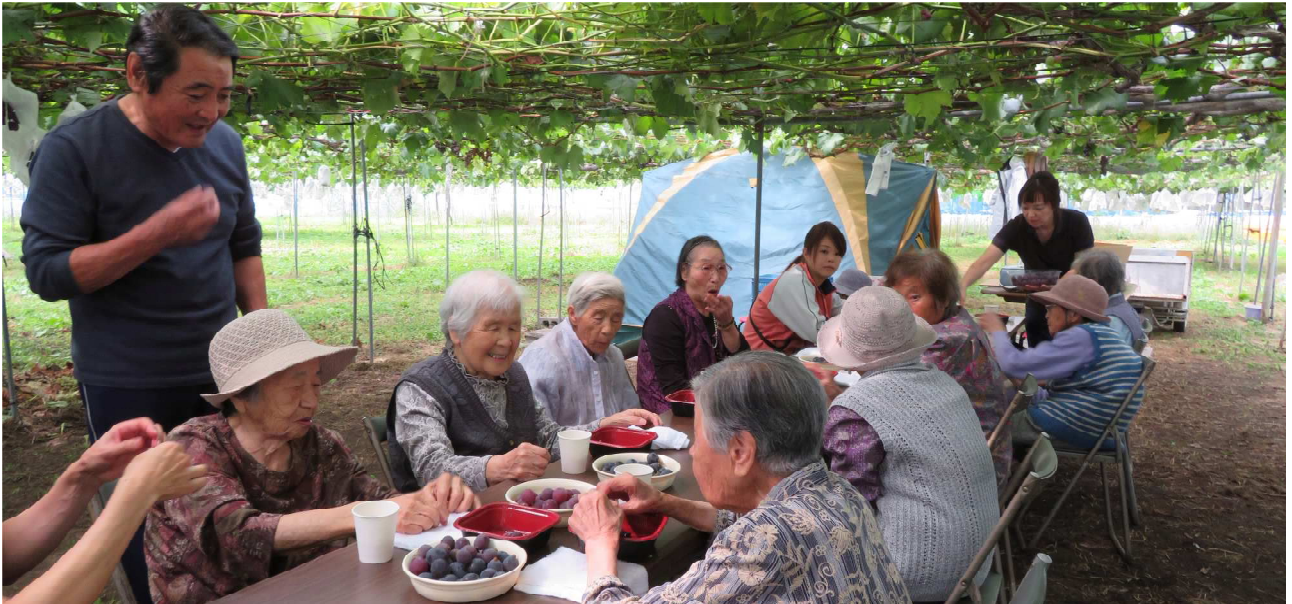
ききょうデイサービスセンターのぶどう狩り