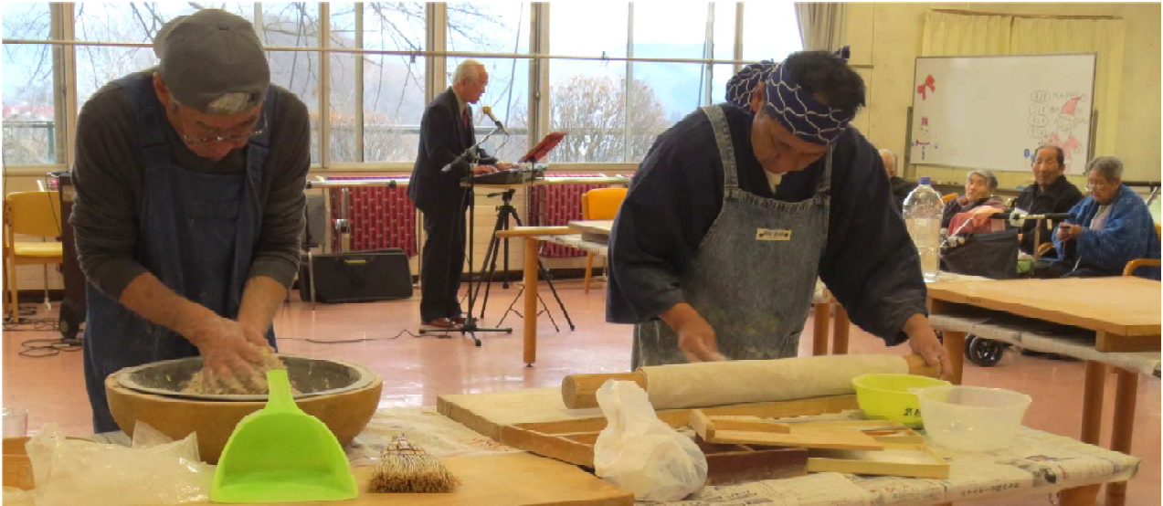
「岳遊」の皆様による蕎麦打ち