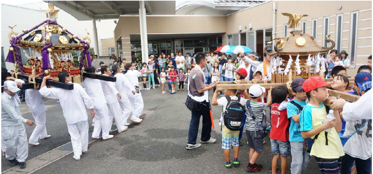
ききょうの里夏祭り