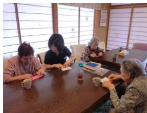
月々のカレンダー作り