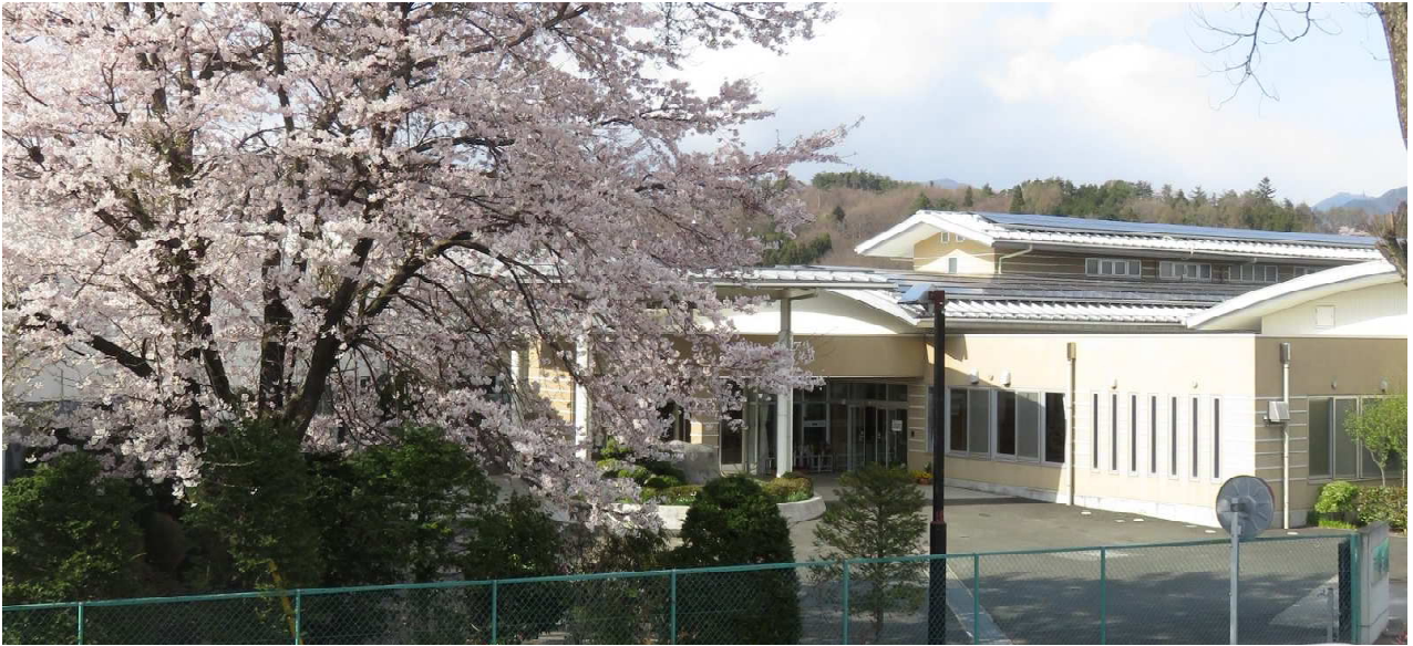
ききょうの里の春