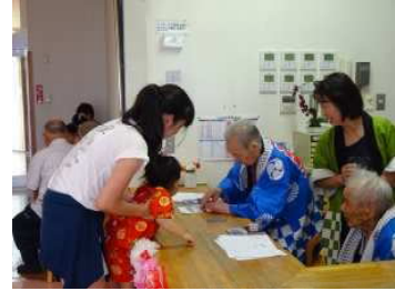
たくさんの子供達ともふれあえ、笑顔でスタンプ押しをしてくださった利用者様。