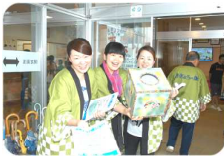
ようこそ！ 楽しんでくださいね！