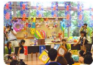
サイコロじゃんけんで大 きな花火を手にしたのは 誰かな～♪