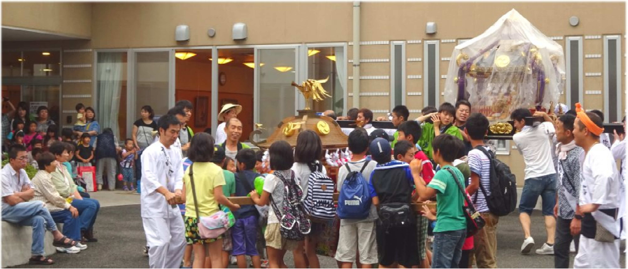
ききょうの里 夏祭り